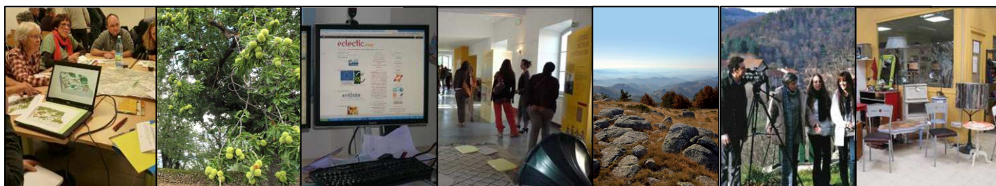
Quelques réalisations emblématiques

Nous sommes tous des enfants de migrants ( Pollen-Scop )